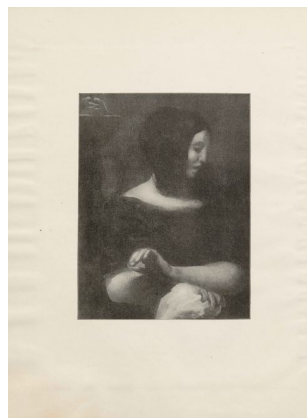
Klingen II, 2, s. 5