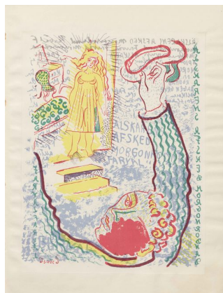
Klingen II, 2, s. 4