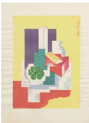
Klingen II, 2, s. 11