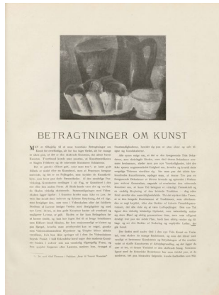
Klingen II, 9, s. 2