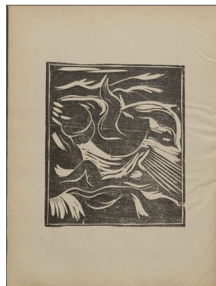
III, 8 s. 5 bagside