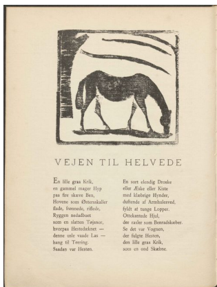
1,5 s. 7