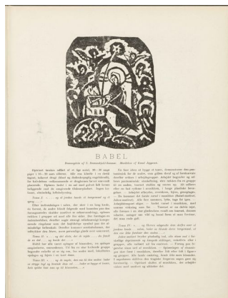
Klingen III, 5, s. 12