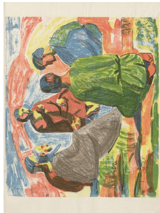
Klingen II, 9, s. 4