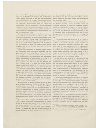
Klingen II, 9, s. 3