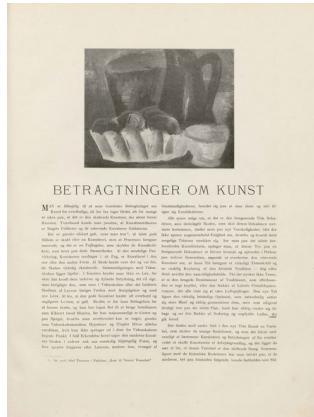
Klingen II, 9, s. 2