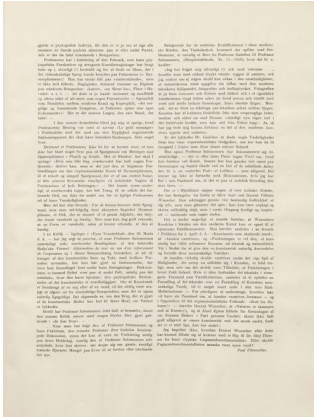
Klingen II, 9, s. 10