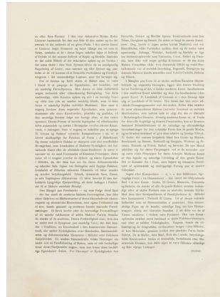
Klingen II, 2, s. 3