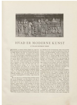
Klingen II, 2, s. 2