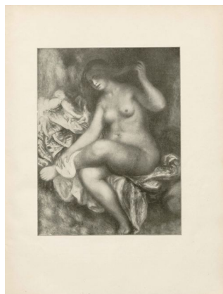
Klingen III, 3-4, s. 2