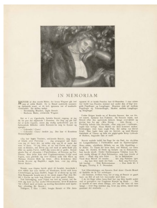
Klingen III, 3-4, s. 4