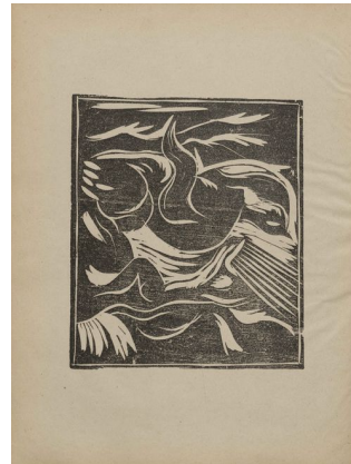
Klingen III, 8, s. 15