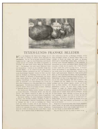
Klingen II, 9 s. 7